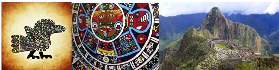
Inkové a Aztékové – symboly

Hernando Cortes dobyl a obsadil v letech (1519–1521) říši Aztéků (= dnešní Mexiko a Kalifornie) a Francisco Pizarro dobyl říši Inků (=dnešní Peru, Jižní Amerika), v letech 1531–1535. Evropané lokální obyvatele okradli, odvezli si drahokamy, kůže apod. a „indiáni“ dostali bezcenné věci (například zrcátka).