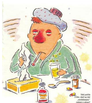
NEMOCNÝ 1 -