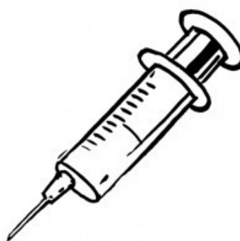
INJEKCE 6 -