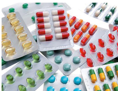
LÉKY 2 -