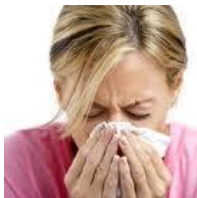
RÝMA 3 -