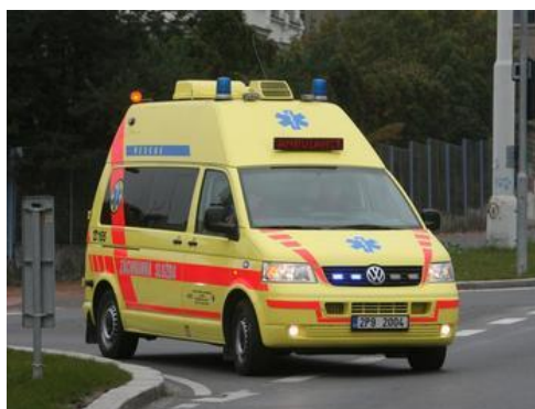
SANITKA 4 -