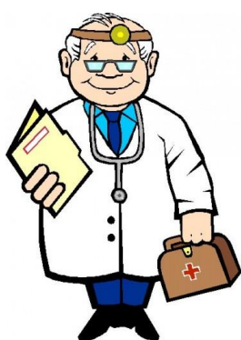
LÉKAŘ 5 -