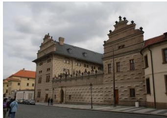
A Schwarzenberský palác

Christian: V Praze existuje několik slavných památek, podívejte se na obrázky.