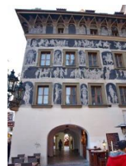
C Dům u Minuty