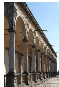
G Letohrádek královny Anny

Dostupné z portálu www.inkluzivniskola.cz , vytvořeného společností META, o.p.s. za finanční podpory Ministerstva školství, mládeže a tělovýchovy ČR. Provoz portálu je spolufinancován z prostředků Evropského fondu pro integraci státních příslušníků třetích zemí.