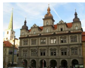
F Malostranská radnice