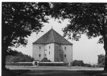
B Letohrádek Hvězda