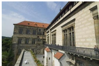
D Vladislavský sál