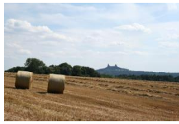
pole (po poli)