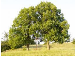
stromy (po stromech)