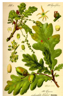
žaludy a listy