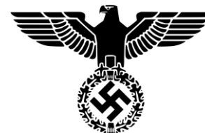
Říšská orlice a hákový kříž