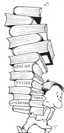
Podle výzkumu Národního ústavu pro vzdělávání by žáci při volbě povolání využili např. informace o náročnosti studia...