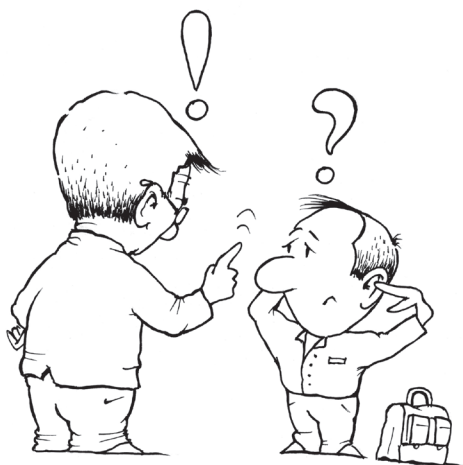
Žáci mají na konci základní školy tendenci zaujímat k rodičům kritický vztah a odmítají jejich pečovatelskou roli...

Jak bylo uvedeno, učitelé, třídní učitelé a poradenští pracovníci mají na volbu povolání žáků menší podíl