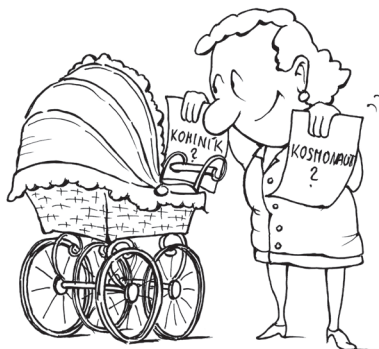
Volba povolání je dlouhodobá záležitost a nelze ji odsunout až na poslední dva roky školní docházky...

Základní školy si mohou vytvořit vlastní koncepci přípravy žáků na volbu povolání, která bude odrážet potřeby žáků dané školy.