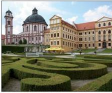
barokní zámek (Jaroměřice nad Rokytnou)