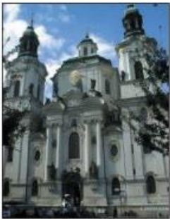
barokní kostel (kostel sv. Mikuláše, Praha)

I Udělejte si ve třídě výstavku pohlednic a fotografií českých a moravských zámků postavených v renesančním a barokním slohu. Porovnejte jejich vzhled.