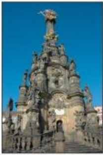
barokní morový sloup (sloup Nejsvětější Trojice, Olomouc)