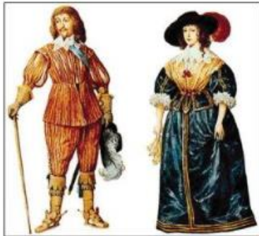
barokní oděv vyšších vrstev

Prostí lidé nosili jednoduchý oděv nebo kroj. V neděli si oblékali lepší sváteční oblečení. Svůj oděv si většinou zhotovovali sami.