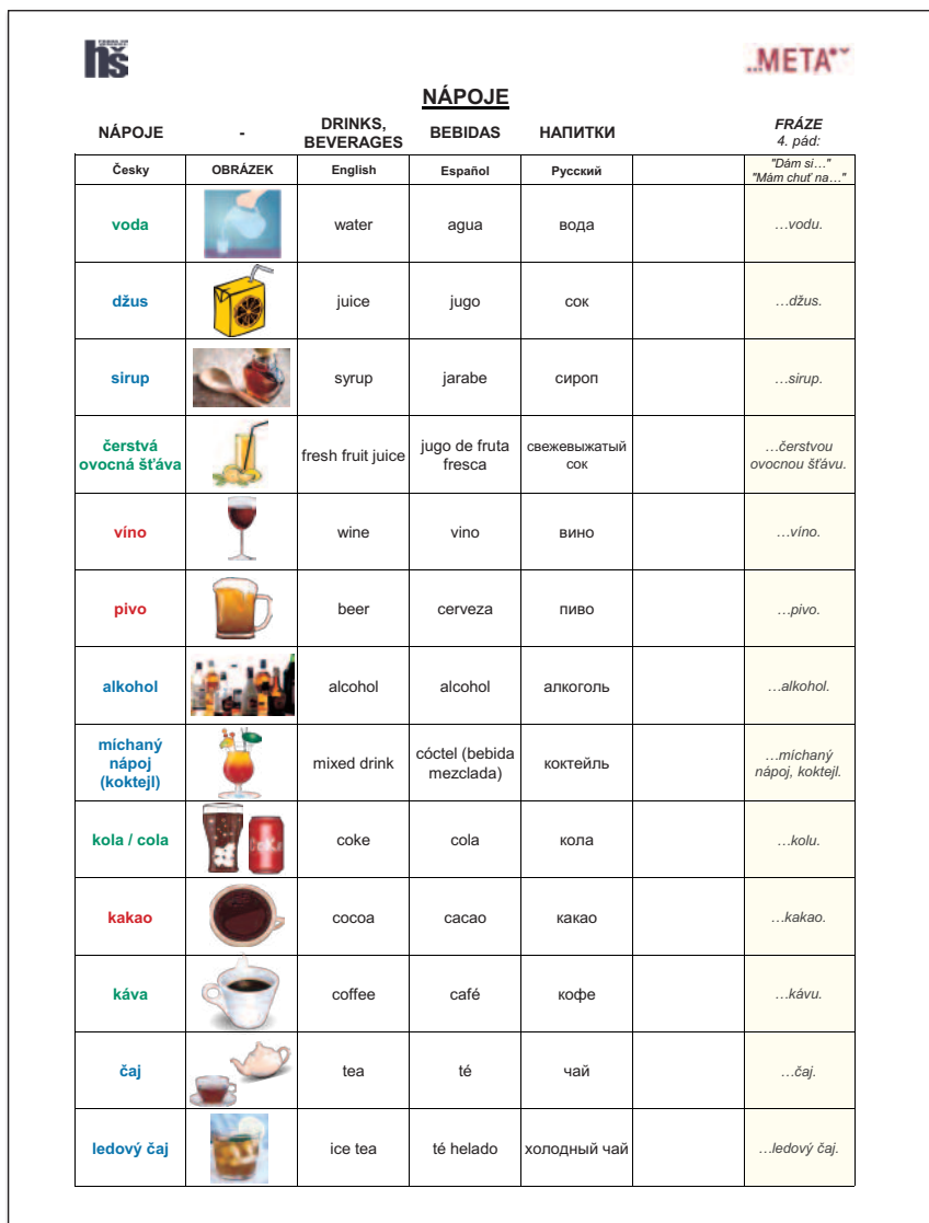
Obr.14: Ukázka části slovníčku pojmů, které žáci s OMJ potřebují znát pro zvládnutí odborných předmětů