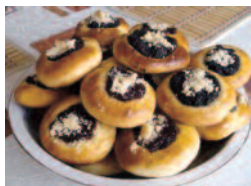
Obr. 2: Ukázka z prezentace připravené pro komunitně-osvětové setkání Ochutnávka vůní podzimu

Další dvě setkání s rodiči se týkala začleňování žáků s OMJ. V lednu 2019 proběhlo setkání zacílené na téma interkulturního vzdělávání a představení projektu zaměřeného na podporu žáků s OMJ, kdy byli rodiče informováni o projektu Podpora inkluze na Hotelové škole Vršovická a byly jim představeny některé pojmy související s interkulturním vzděláváním. V únoru 2020 se uskutečnilo setkání rodičů s aktéry podílejícími se ve škole na začleňování žáků s OMJ. Rodiče se při něm dozvěděli, co se za první rok společné práce podařilo, a seznámili se s nástinem dalšího vývoje.